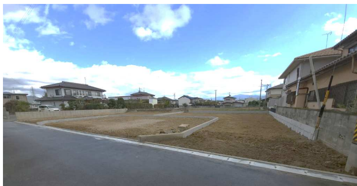
現地造成完了 2022年11月上旬ころ