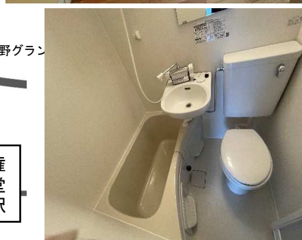
図面と相違する場合は現況を優先します